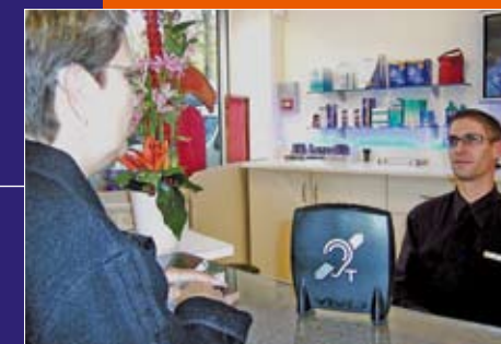
A un guichet, boîtier «boucle magnétique» pour personne déficiente auditive équipée.