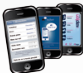
applications pour Smartphones