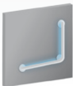
barre d'appui éclairée

Le soutien de la CNSA doit fournir le temps à ces centres de démontrer leur utilité et de construire un modèle économique durable qui devra s'appuyer sur les dispositifs de soutien de la recherche et de l'innovation et bénéficier des nouveaux financements de la prestation de compensation.